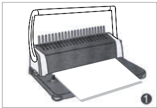
1. 용지를 원고 투입구에 넣어줍니다.