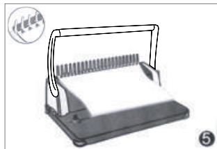
5. 벗어진 링에 천공된 원고를 끼워줍니다.