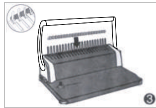
3. 핸들이 수직이 되게 한 다음 제본물에 플라스틱 링을 걸어줍니다.