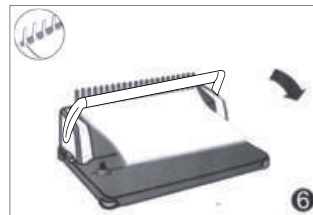
6. 핸들을 수직으로 당기면 링이 닫히며 제본이 완성됩니다.